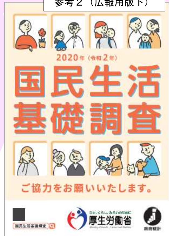
(2020(令和2)年国民生活基礎調査のポスター)